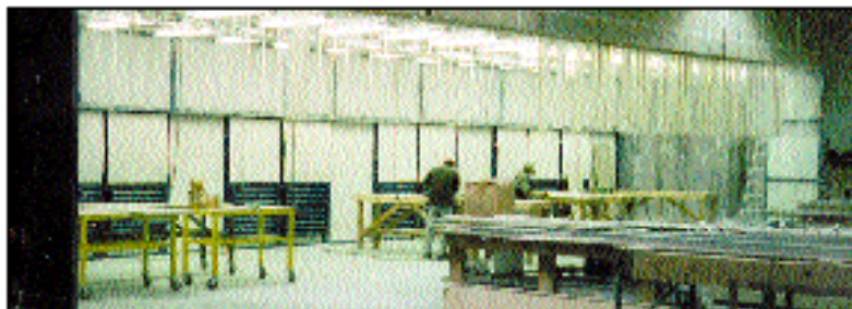
Кабина контроля окружающей среды

Блок ЕСВ компании Дональдсон создаёт независимые условия работы, укомплектован светосигнальным оборудованием, звукоизоляцией и встроенной системой пылеулавливания. Рабочие внутри кабины пользуются полной свободой действий, более чистым воздухом и отличной видимостью. Благодаря отличным фильтрующим свойствам, которые обеспечивает применение фильтровального материала Ультра-Веб, изготовленного с применением патентованной технологии нанесения микроволокон, блок ЕСВ предотвращает перенос пыли в другие производственные помещения, защищая рабочих за пределами кабины от пыли и шума, образующихся внутри кабины.